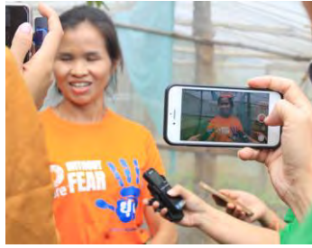
ຂະບວນທັດສະນະສຶກສາຂອງນັກຂ່າວລາວ ພາຍໃຕ້ໂຄງການ GAMCIL

ການທັດສະນະສຶກສາຂອງນັກຂ່າວພາກໃຕ້ ທີ່ໂຄງການເສີມສ້າງຄວາມເຂັ້ມແຂງໃຫ້ແກ່ແມ່ຍິງ ໂດຍຜ່ານລະບົບຕ່ອງໂສ້ການສ້າງມູນຄ່າເພີ່ມ ຂອງຜະລິດຕະພັນກາເຟ ທີ່ມີຈັນຍາບັນ ແລະ ເປັນມິດກັບສິ່ງແວດລ້ອມ (SuPER WE Coffee) ແມ່ນໄດ້ລົງເກັບກຳຂໍ້ມູນ ແລະ ສຳພາດຜູ້ທີ່ໄດ້ຮັບຜົນປະໂຫຍດ ໃນກິດຈະກຳ ຂະບວນການຜະລິດກາເຟຜູ້ອອຍດາກຈຶງ, ການສ້າງຄວາມເຂັ້ມແຂງທາງດ້ານເສດຖະກິດໃຫ້ແກ່ແມ່ຍິງ ລວມໄປເຖິງການມີສ່ວນຮ່ວມຂອງຄອບຄົວ.