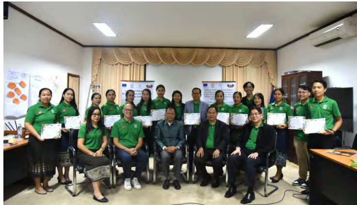
ຝຶກອົບຮົມຄູຝຶກນັກຂ່າວລາວ ຫົວຂໍ້ “ການລາຍງານຂ່າວບັນຫາສີຂຽວ”