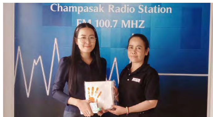
ການປຸກຈິດສຳນຶກ ແລະ ລົນນະລົງການຕ້ານການໃຊ້ຄວາມຮຸນແຮງຕໍ່ແມ່ຍິງ ແລະ ເດັກຍິງ