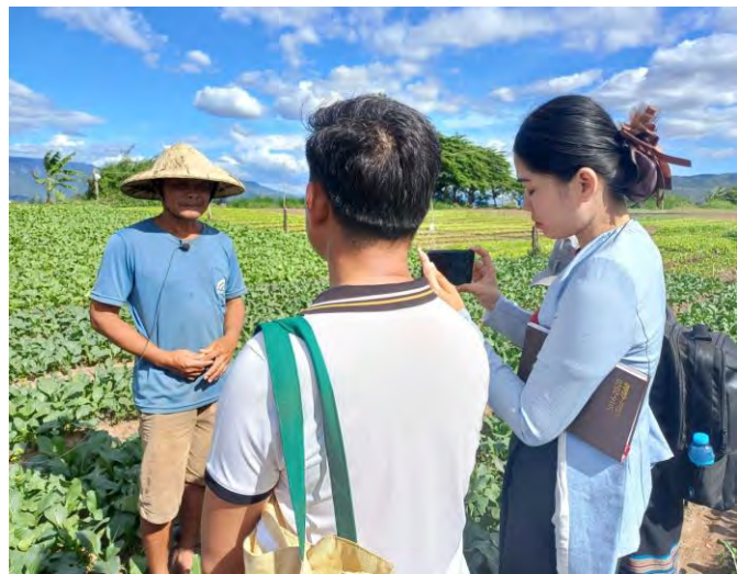
ຝຶກອົບຮົມນັກຂ່າວ ຫົວຂໍ້ “ການລາຍງານຂ່າວບັນຫາສີຂຽວ”

ໃນການຝຶກອົບຮົມໃນຄັ້ງນີ້ ນັກຂ່າວລາວ ແມ່ນໄດ້ຝຶກ ແລະ ຮຽນຮູ້ກ່ຽວກັບການຂ່າວຂ່າວດ້ວຍຮູບແບບໃໝ່ທີ່ສົນກະທັດຫັດ ແຕ່ກວມລວມເນື້ອໃນ, ການລາຍງານຂ່າວກ່ຽວກັບສີຂຽວ, ການຊອກຫາແຫຼ່ງຂໍ້ມູນທີ່ໜ້າເຊື່ອຖືໄດ້, ການຂຽນບົດເລື່ອງກ່ຽວກັບບັນຫາສີຂຽວ, ການຖ່າຍຮູບພາບໃຫ້ມີຄວາມໜ້າສົນໃຈ, ການນຳໃຊ້ເຄື່ອງມືຄານວ່າ (Canva)