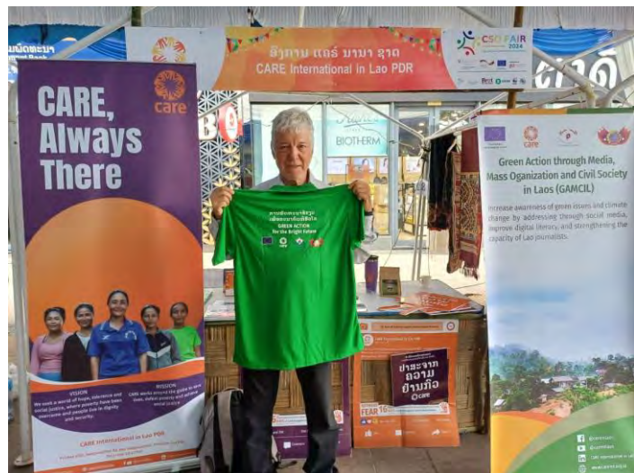
ງານວາງສະແດງຜົນງານ ແລະ ຜະລິດຕະພັນຂອງ ອົງການຈັດຕັ້ງສັງຄົມ ປະຈຳປີ 2024