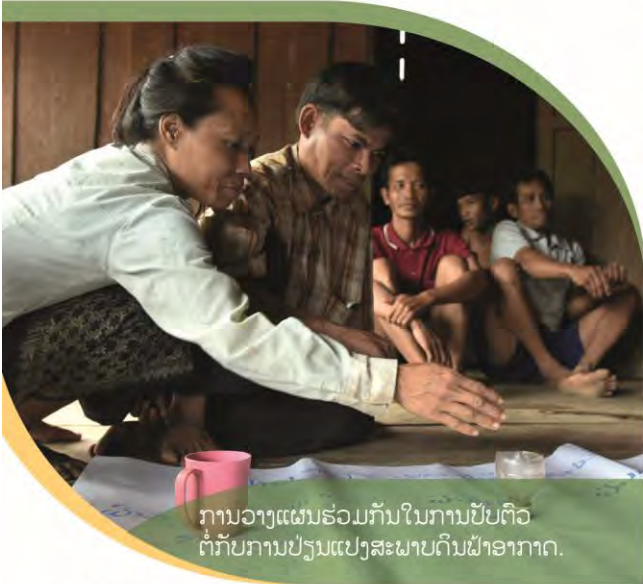
ການວາງແຜນຮ່ວມກັນໃນການປັບຕົວ ຕໍ່ກັບການປ່ຽນແປງສະພາບດິນຜ້າອາກາດ.